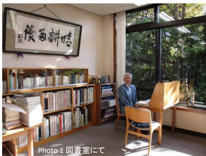
Photo 1 図書室にて

斯の如く、近況は「晴ゴルフ散歩・雨読」に過ぎません。み国への御奉公は最早かなわず、卒業生諸君の活躍に俟つ許りです。そこで、諸君に繰返します。「考えて、考えて、考え抜け」、「1日生きる事は1歩進むことでありたい」、「好漢卒業生諸君、奮励一番せよ、母校の名誉を挙げよ」。