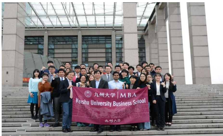
学中央図書館前の広場にて、浙江大学側の参加者学生及び教授との集合写真

当初キャッシュレスについて、賛成派と反対派のグループに分かれてのディスカッション予定であったが、渡航し目の前で、バイクの利用や店舗での決済を見る中、全チームで、メリット・デメリットを通して、キャッシュレス社会がもたらすインパクトについて考えることになった。ZJUとQBSのグループワークは、留学生も多く自国でのキャッシュレス事情の話しもでて、様々な視点で考えることができた。各教授から具体的な指摘をいただくことで今後キャッシュレスをどう生かして良い社会を作りあげていくかを考えさせられた。