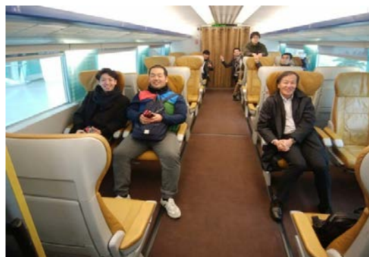
リニアモーターカー（左）、列車内の様子（右）